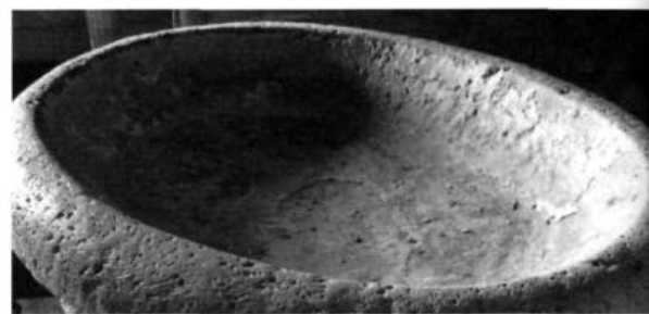
1 • Cf. tableau 1.

La théorie de Manfred Max-Neef nous permet de voir le lien qu'il y a entre la façon dont nous décidons de satisfaire ces besoins et la société dans laquelle nous vivons.